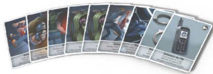
27 cartes Action