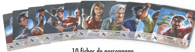
10 fiches de personnage